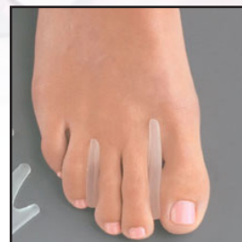
805145 - S 805150 - M 805155 - L