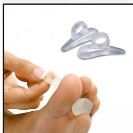
IZQUIERDO 805100 - S 805105 - M 805110 - L