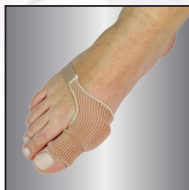
Talla Única/Universal Size-802220