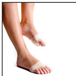
802200 - S 802205 - L