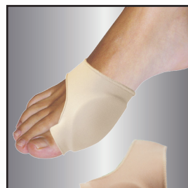
802210 - S 802215 - L