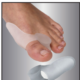
805165-Talla Única | Universal Size