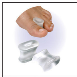
805130 - S 805135 - M 805140 - L