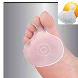
805160-Talla Única/Universal Size